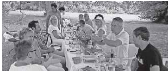
Noch regnet es nicht